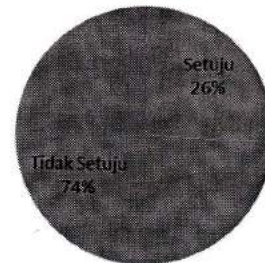
Sikap Orang Tua Terhadap Pengembangan Kreativitas di Lembaga PAUD

Lebih detail data penelitian menunjukkan, persentase orang tua yang setuju jika PAUD hanya mengembangkan kreativitas anak sebesar 26%. Persentase orang tua yang setuju jika lembaga PAUD membelajarkan membaca sebesar 76%. Persentase orang tua yang setuju jika lembaga PAUD membelajarkan menghitung sebesar 76%. Persepsi orang tua terhadap kreativitas dan membaca menunjukkan jumlah orang tua yang menganggap kreativitas lebih penting dari kemampuan membaca sebesar 45% yang berarti 55% diantara orang tua menganggap tidak lebih penting. Persepsi orang tua terhadap kreativitas dan menghitung menunjukkan jumlah orang tua yang menganggap kreativitas lebih penting dari menghitung sebesar 45% yang berarti 55% diantara orang tua menganggap tidak lebih penting. Data tersebut di atas cukup bertentangan dengan pendapat orang